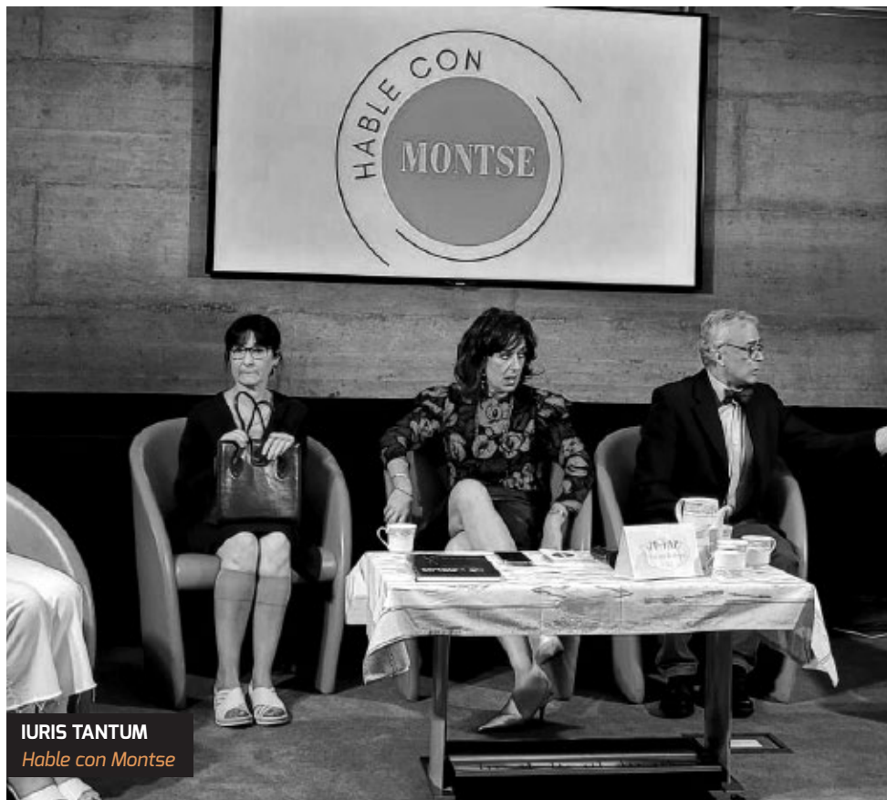
IURIS TANTUM Hable con Montse