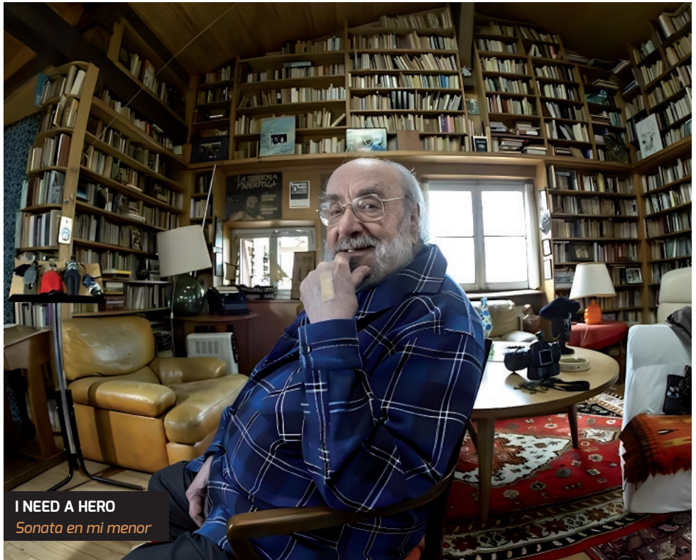
I NEED A HERO Sonata en mi menor

Jatorrizko testua / Texto original: Alfonso Sastre